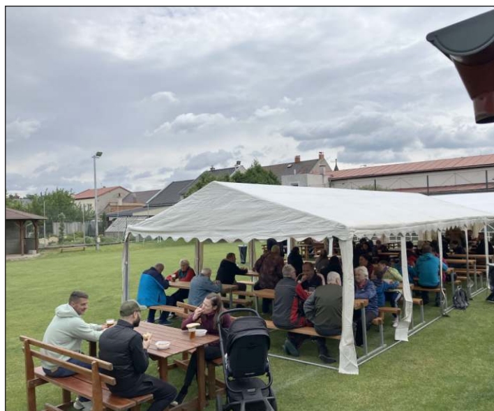
Hodový guláš všem chutnal