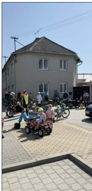
Fichtly připravené na vyjžd'ku