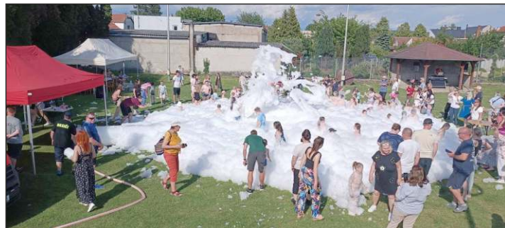
Grygovští hasiči připravili pro děti hromadu pěny...