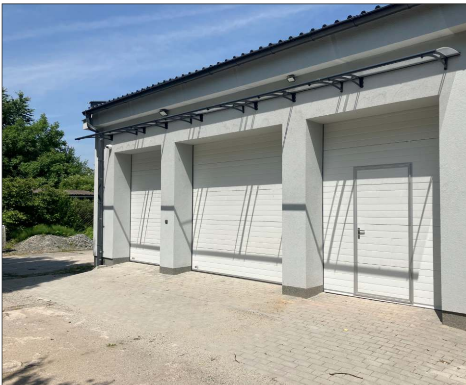
Grygov má nové zázemí pro techniku pracovní skupiny obce. Více fotografií najdete uvnitř novin

sobota 30. srpna LETNÍ KINO na sportovním areálu