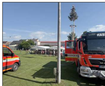
...a dohlíželi na bezpečnost celé akce