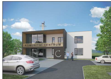
Vizualizace Komunitního centra Grygov

pisu smlouvy se stavební firmou budou moci začít stavební práce. Věříme, že ještě letos na podzim. Po dokončení stavby vznikne prodejna potravin, dvě ordinace pro lékaře a zubaře, klubovna pro místní spolky a konferenční sál pro 50 lidí. Víme,