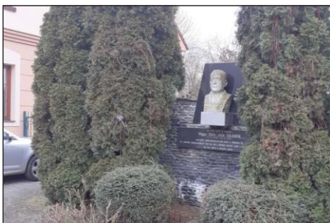
Pohled na památník Jana Šrámků, na ulici téhož jména, vlevo budova Obecního úřadu Grygov