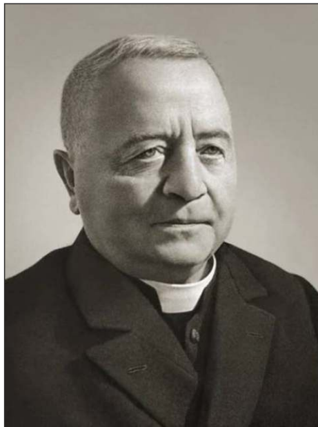
Msgr. ThDr. Jan Šrámek, (11. 8. 1870 Grygov – 22. 4. 1956 Praha)

signore“ z francouzštiny, něco jako „můj pane“. Postupem času se slovo přizpůsobovalo aktuálně době. Titul se přenesl i na půdu církví. V římskokatolické církvi, byl a je, titul Msgr. znakem vyjádření pocty určité osobě, jejímu postavení, výši a rozsahu dosaženého vzdělání a zastávanému úřadu. Titul ThDr. znamená - doktor teologie, jedná se taktéž o akademický titul udělovaný při ukončení studia v oblasti bohosloví (teologie) na vysokých školách. V Olomouci dodnes existuje Cyrilometodějská teologická fakulta při Univerzitě Palackého.