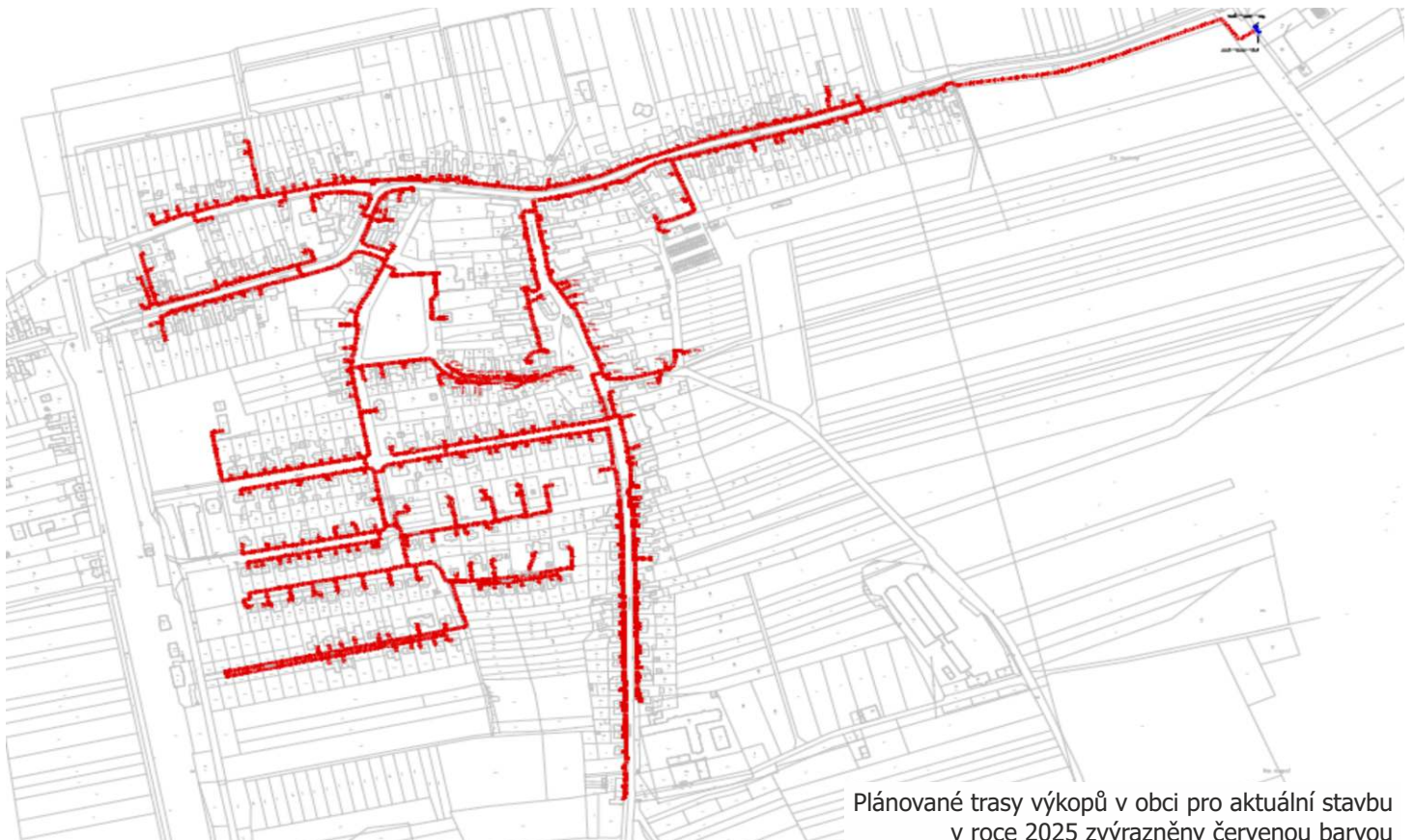
Plánované trasy výkopů v obci pro aktuální stavbu v roce 2025 zvýrazněny červenou barvou

Odpovědná osoba zhotovitele, stavbyvedoucí: Patrik Holíček holicek@suptel.sk