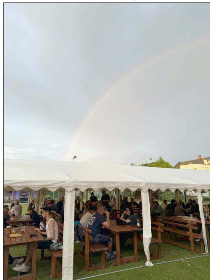
Pohodovou atmosféru akce ozdobila podvečerní duha