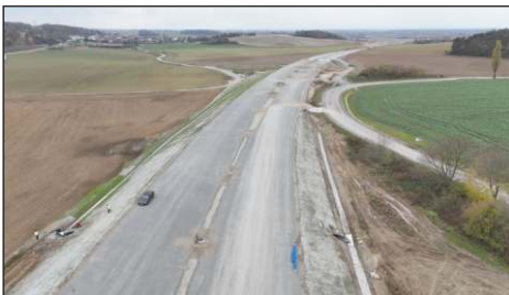
D55 v místě U křížku