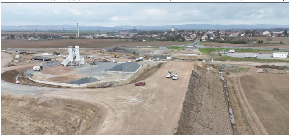
Pohled od Grygova k Velkému Týnci