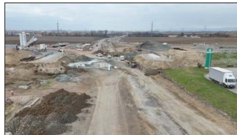
Základy budoucího mostu v místě týnecké křižovatky