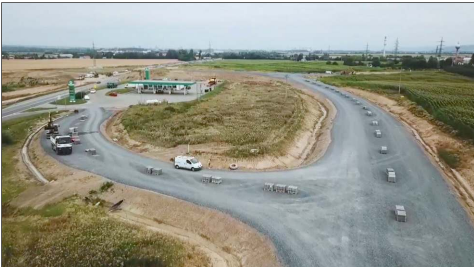
Stavba D55 u čerpací stanice PRIM