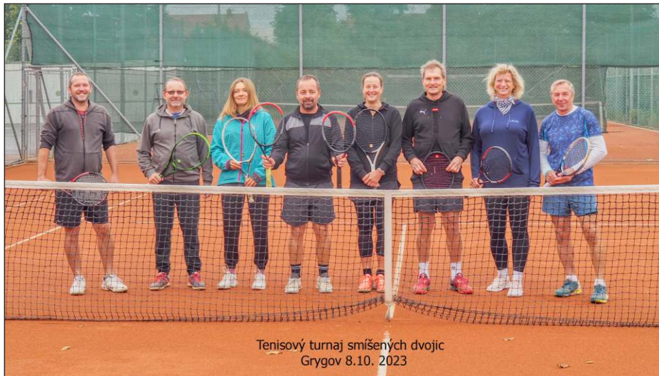
Tenisový turnaj smíšených dvojic Grygov 8.10. 2023