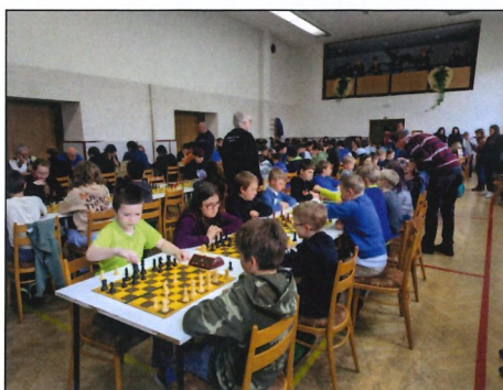
Krajský přebor dětí a mládeže Olomouckého kraje 2023 v grygovské sokolovně

Jakub Fuksík Richard Bielek st. www.a64.cz