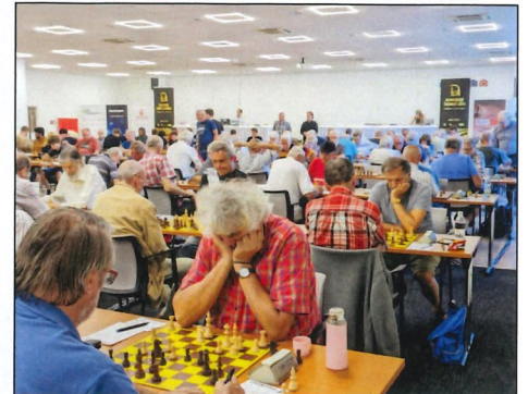
Mezinárodní festival Olomoucké šachové léto 2023 – hrací sál v Hotelu Flora

První velkou akcí bylo soustředění mládeže v Náměšti na Hané v létě 1991. Následovaly rapid turnaje pro mládež v Grygově a Olomouci, zájezd na šachový turnaj do Běloruska a také k moři do Bulharska. Velice zdařilým počinem byl mezinárodní juniorský turnaj GP Mláďí open v letech 1992 – 1997, který pomohl celé generaci budoucích velmistrů. Dalším krůčkem byla Mistrovství Moravy jednotlivců 1993 – 1995 a především Mistrovství ČR jednotlivců v Olomouci 1995. Roku 1996 se dokonce podařilo v Olomouci uspořádat základní skupinu Evropského poháru družstev. Roku 1997 se uskutečnil první velmistrovský turnaj v olomoucké historii, jež nebyl dodnes výkonnostně překonán.