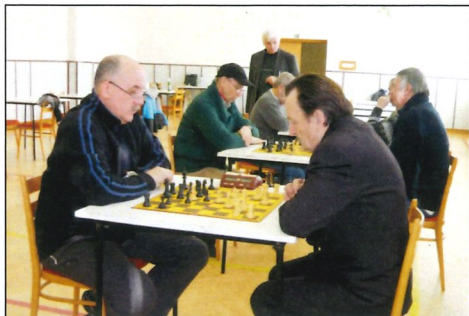
Vzpomínkový turnaj seniorů v Grygově