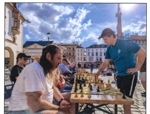
Simultánka šachového velmistra Pavla Šimáčka na olomouckém Horním náměstí

V roce 1998 se uskutečnil 1. ročník festivalu Olomoucké šachové léto, který si brzy vydobyl přední příčku mezi šachovými festivaly v ČR. Turnaj se koná pravidelně (s výjimkou let 2020 a 2021) dodnes a účastní se ho každoročně na tři stovky šachistů z více než 20 zemí světa. Festivalu vždy předchází tradiční simultánka před olomouckým orlojem, kde proti desítkám přichozích nastupuje některý z šachových velmistrů.