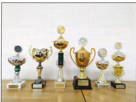
Sbírka extraligových pohárů A64 Grygov za medailová umístění