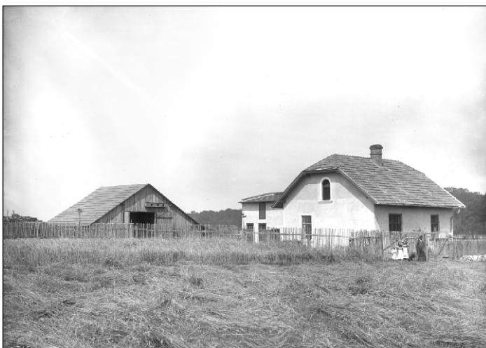
Grygov, hájenka při cestě k Majetínu, snímek kolem roku 1900

Osudného dne v úterý 7. srpna 1928 před 2. hodinou odpolední odešel hajný Lubrich z domu na pochůzku lesem jen s holí, neozbrojen a bez doprovodu psa. Při procházení lesem jej ve XII. oddíle zaregistrovaly lesní dělnice, které zde pracovaly. K 5. hodině odpolední byla z lesa slyšet střelná rána a hned na to se ozvalo hvízdání na prsty signalizující, že hajný potřebuje pomoc. Pak zazněla druhá rána, další pískání, které však rychle utichlo. Podle zvuku byla palnou zbraní kulovnice. Jedna svědkyně, která byla v lese pro trávu, vypověděla, že k ní přiběhl asi půlhodiny před střelbou hajný a ptal se, jestli