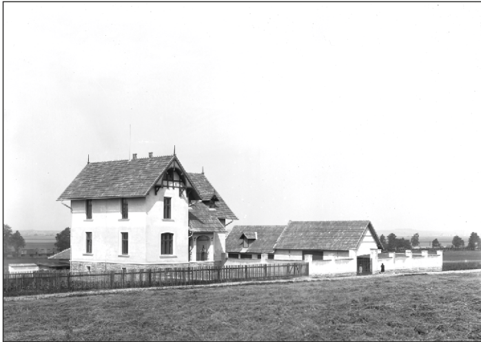
Grygov, myslivna V Podlesí, snímek kolem roku 1900, Vlastivědné muzeum v Olomouci, fotoarchiv

Tragická událost, jakou je vražda, se v klidných vesnicích na Hané nestává (a ani v minulosti nestávala) často. Nežijeme ve fiktivním seriálovém městečku Midsomer, kde mají mordy na denním pořádku, a proto takový ojedinělý hrůzný čin vždy vzbudí pozornost nejen vyšetřovacích orgánů, ale i občanů a novinářů.